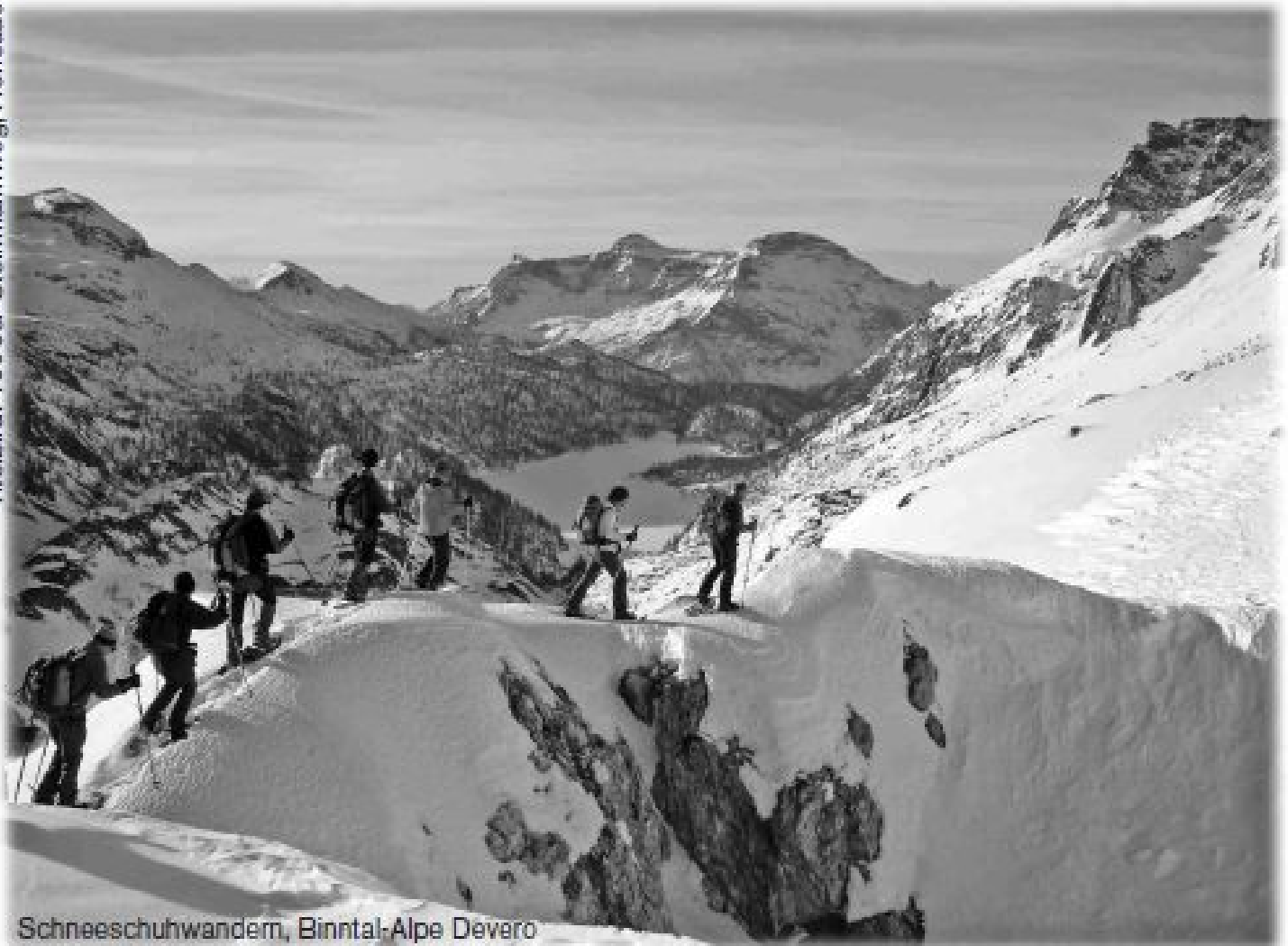
Schneeschuhwandern, Binntal-Alpe Devero